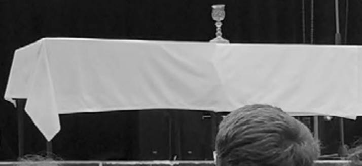
(Ne)přátel se nelekejme, na množství nehleďme (Tábor, 26. 9. 2021)

Kdož jste Boží bojovníci a zákona jeho, prostež od Boha pomoci a doufejte v něho, že konečně s ním vždycky zvítězíte! Kristus vám za škody stojí, stokrát víc slibuje; pak-li kdo proň život složí, věčný miti bude: blaze každému, kdož na pravdě sejde! Ten Pán velí se nebáli záhubců tělesných, velí i život složití pro lásku svých bližních.